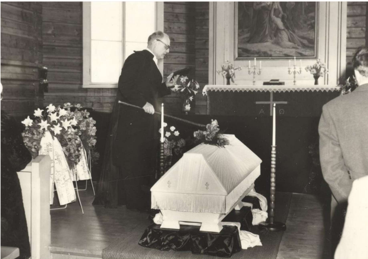
Tässä vuoden 1960 hautajaiskuvassa näkyy taustalla vanha kadonnut antependium.