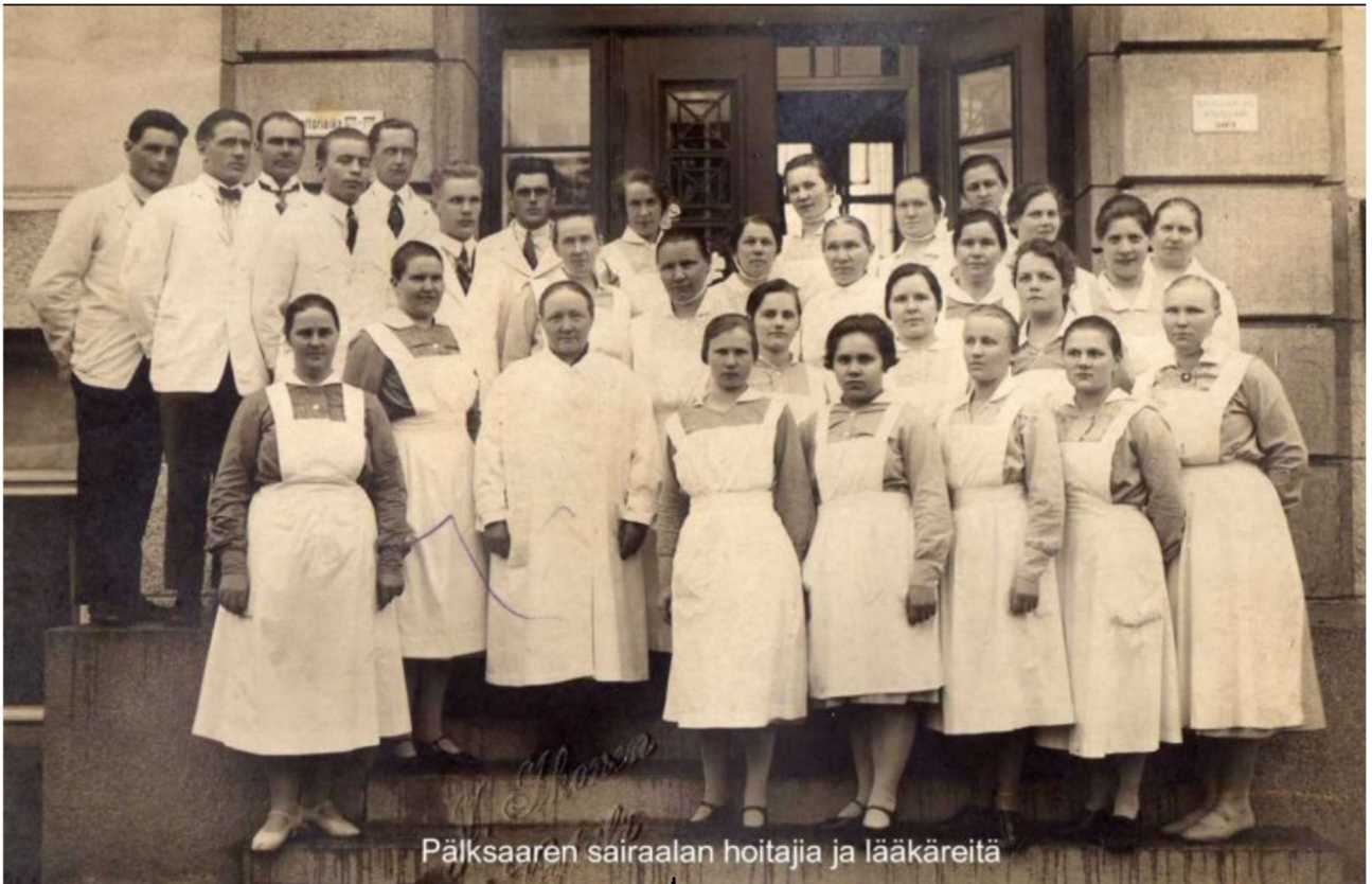
Pälksaaren sairaalan hoitajia ja lääkäreitä