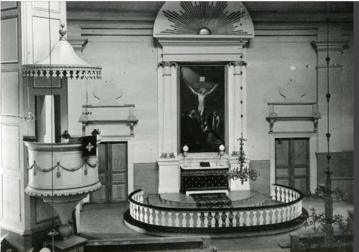
Kuva vuodelta 1931. Koristelevy näkyy alttarin yllä. Sen keskiosassa alhaalla on ollut alkujaan messinkinen tai kultamaalattu puinen koriste, joka on hävinnyt.