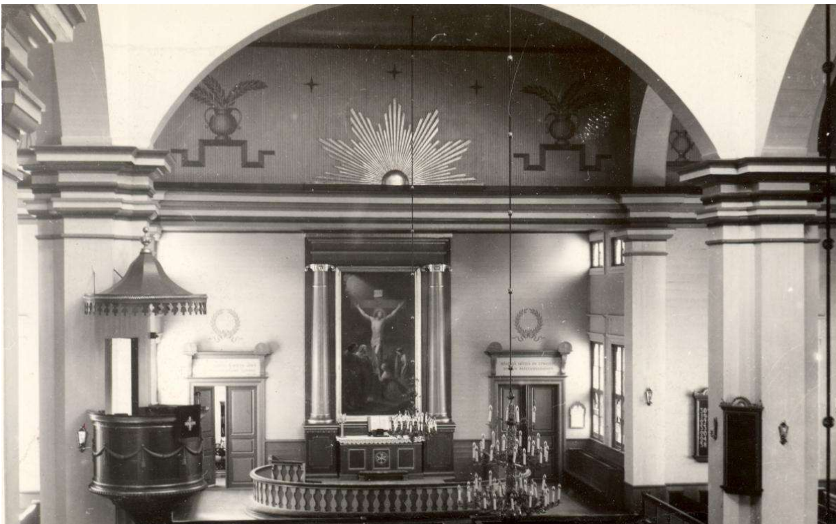
Kirkko peruskorjauksen jälkeisessä asussaan. Uusista koristemaalauksista vastannut taidemaalari Lauri Välke maalasi alttarin yläpuolelle vanhaa alttarikoristetta jäljittelevän maalauksen. Sen keskikoriste näyttää hyvin samanlaiselta kuin aikanaan vanhassa koristelevyssä – kenties se on sama.