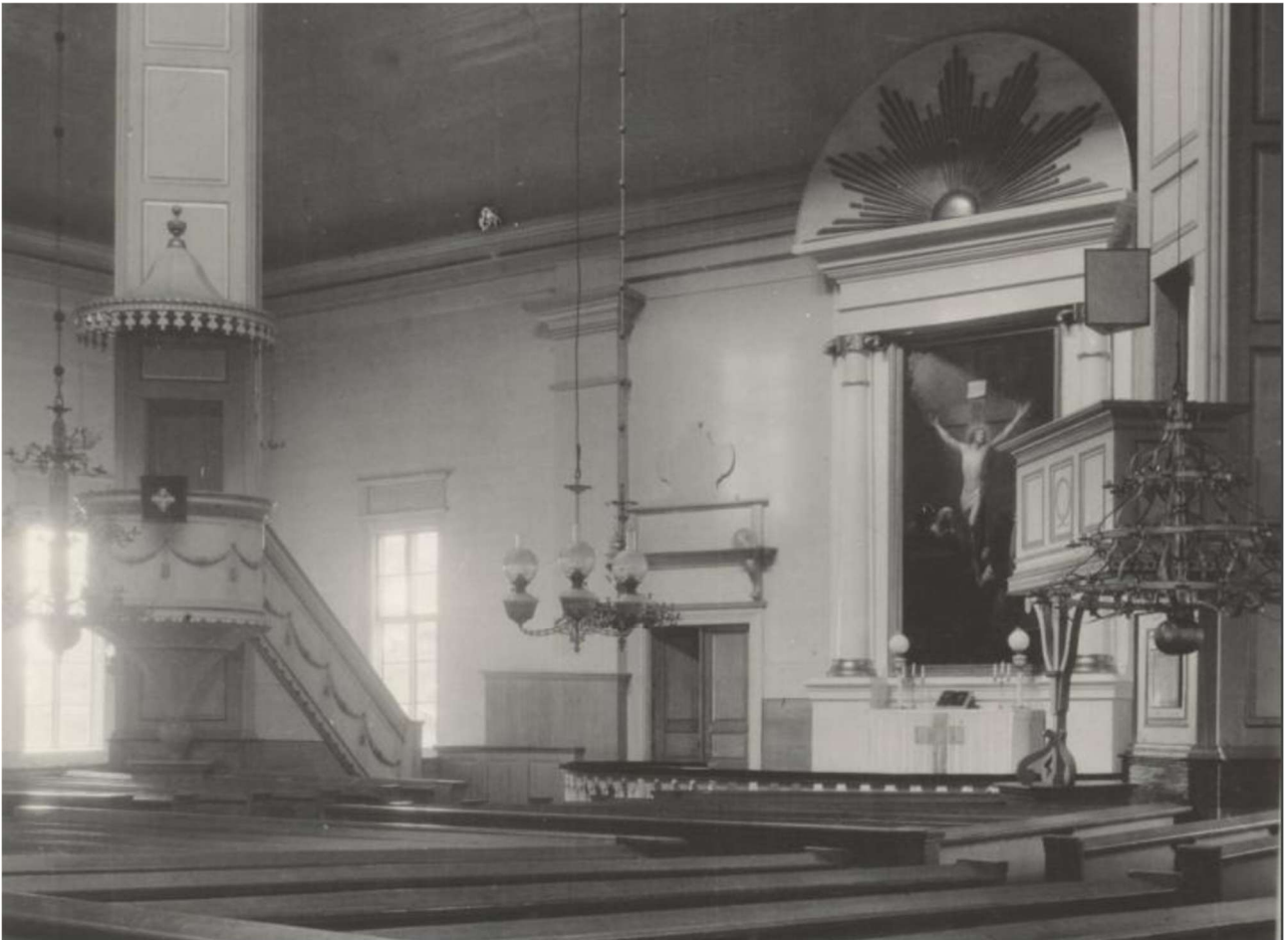
Kattokruunu näkyy tässä ennen 1935–1936 remonttia otetussa kuvassa oikealla lukkarinpenkin edustalla.