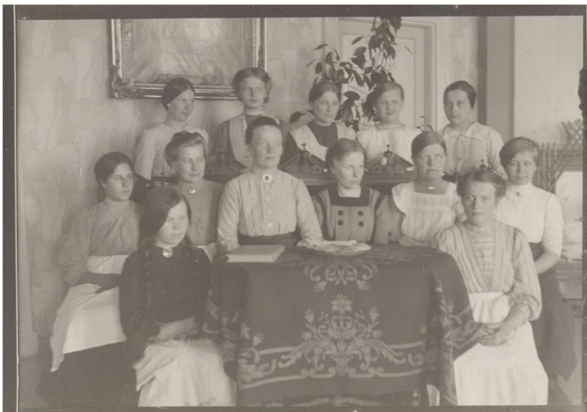
Kutomakurssilaisia Viekin pappilan salissa 1910-luvun lopulla. Madonna taulu näkyy taustalla.