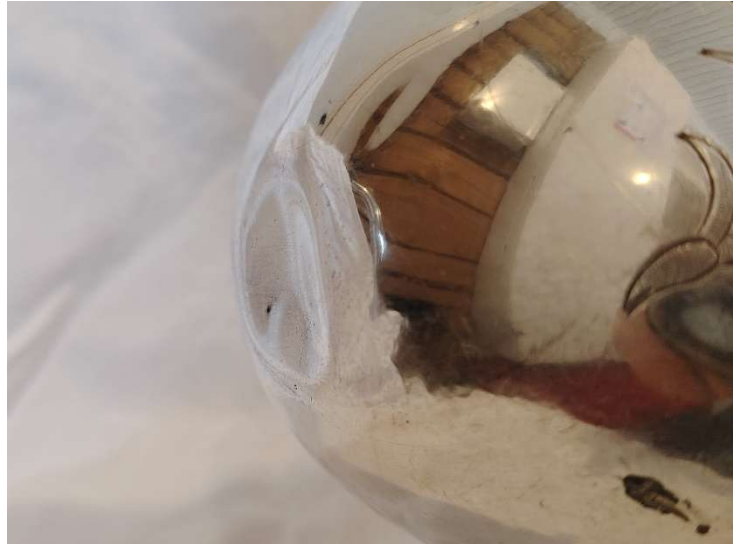
Lommo kannun kyljessä. Muisto varkaudesta?

Kannu otettiin pois käytöstä marraskuussa 2025, koska sen hopeointi on syöpynyt ja alpakassa oleva nikkeli voi liueta viiniin. Kultasepäntuotteissa todettiin, että sitä ei voi hopeoida uudelleen.