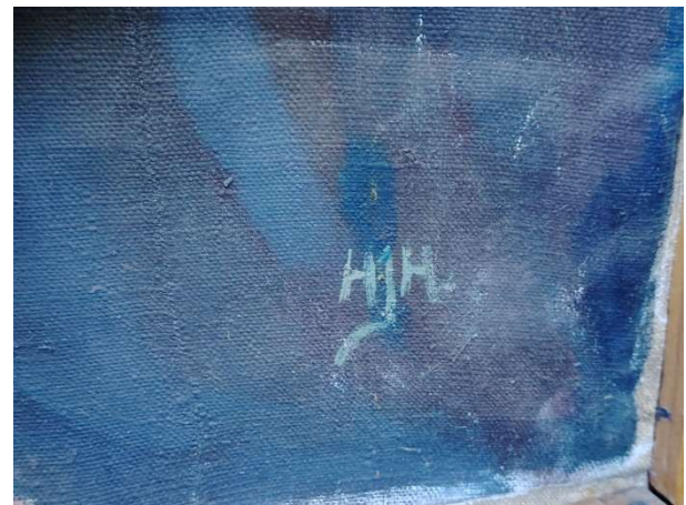
Hulda Hakulisen signeeraus maalauksen kulmassa.