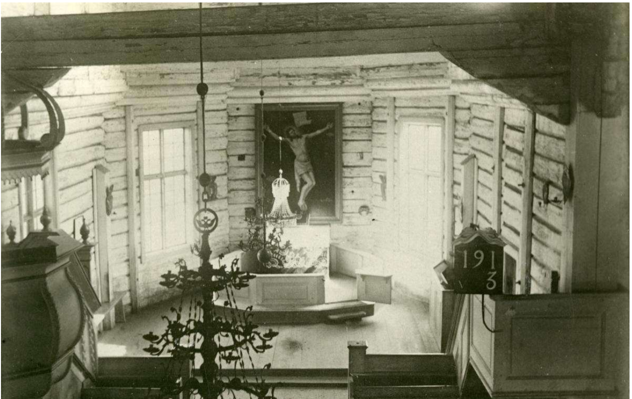
Kuva Kajaanin vanhasta kirkosta noin vuodelta 1890. Kirkon seinillä näkyy lampetteja.

Vanhan kirkon kuorissa näkyy seinällä samankaltaisia yhden kynttilän lampetteja noin vuonna 1890-otetussa kuvassa. Siirretty ilmeisesti uuteen kirkkoon sen valmistuttua 1896. Osa lampeteista sähköistetty jossain vaiheessa. Poistettu kirkosta kalustoluetteloiden mukaan noin vuosien 1956 ja 1969 välillä. Muutama lampetti deponoitiin Kainuun museoon vuonna 1979. Rongenin laatta annettiin Kainuun museoon 1996 ja se on näytteillä museon vitriinissä.