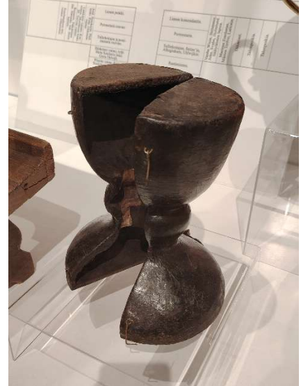
Kalkin ja pateenin kotelo Kainuun museon vitriinissä. Mahdollisesti alkuperäinen.

Kasukka ja ehtoollisesineet ovat saapuneet Kajaaniin luultavasti vuonna 1740. Vuonna 1741 on sodan pelossa (hattujen sota ja pikkuviha) kirkkoherran kanssa lähetetty kalkki, öylättilautanen ja messupuku Ouluun kauppias Galleniukselle talteen. Kirkon kello, kynttiläjalkoja, rahoja ym. kätettiin maahan.