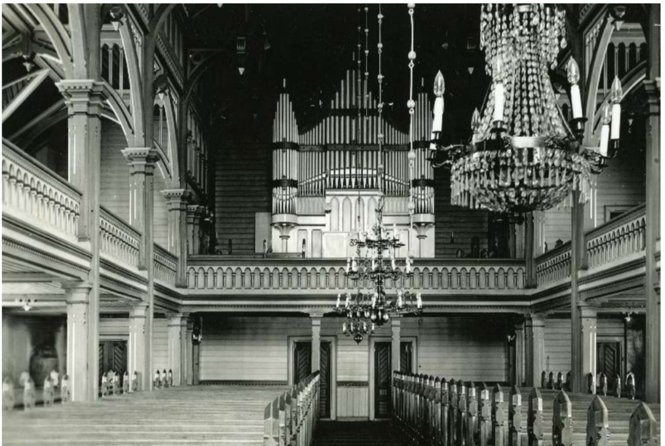
Kruunu on jo sähköistetty tässä vuoden 1928 kuvassa.