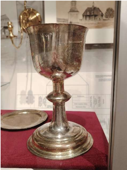
Kalkki Kainuun museon vitriinissä.