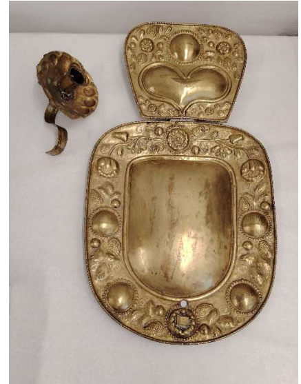
Toinen Kainuun museolla olevista lampeteista. Ei näyttelyssä.

Vanhan kirkon kuorissa näkyy seinällä samankaltaisia yhden kynttilän lampetteja noin vuonna 1890-otetussa kuvassa. Siirretty ilmeisesti uuteen kirkkoon sen valmistuttua 1896. Osa lampeteista sähköistetty jossain vaiheessa. Poistettu kirkosta kalustoluetteloiden mukaan noin vuosien 1956 ja 1969 välillä. Muutama lampetti deponoitiin Kainuun museoon vuonna 1979. Rongenin laatta annettiin Kainuun museoon 1996 ja se on näytteillä museon vitriinissä.