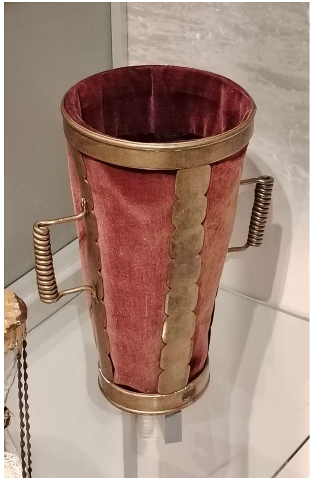
Kolehtihaaveissa on messingistä taottu kartionmuotoinen kehikko, jossa kaksi messingistä kierrettyä kädensijaa. Kehikkoon on upotettu ruskeanpunertavasta, lyhynukkaisesta puuvillasametista ommeltu pyöreäpohjainen pussi, jossa musta puuvillasatiinivuori.

Deponoitu Kainuun museoon vuonna 1979. Eivät olleet 2025 näyttelyssä.