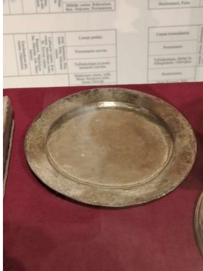
Pateeni Kainuun museon vitriinissä.