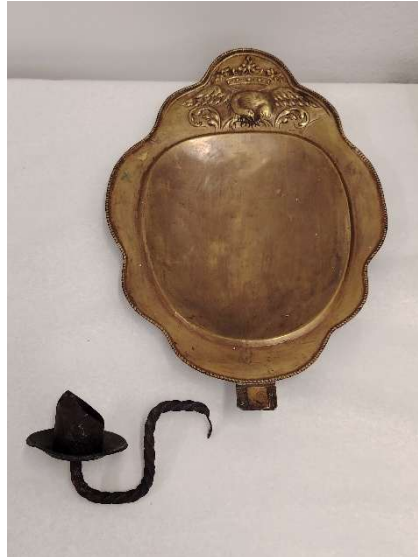
Toinen Kainuun museolla olevista lampeteista. Ei näyttelyssä.