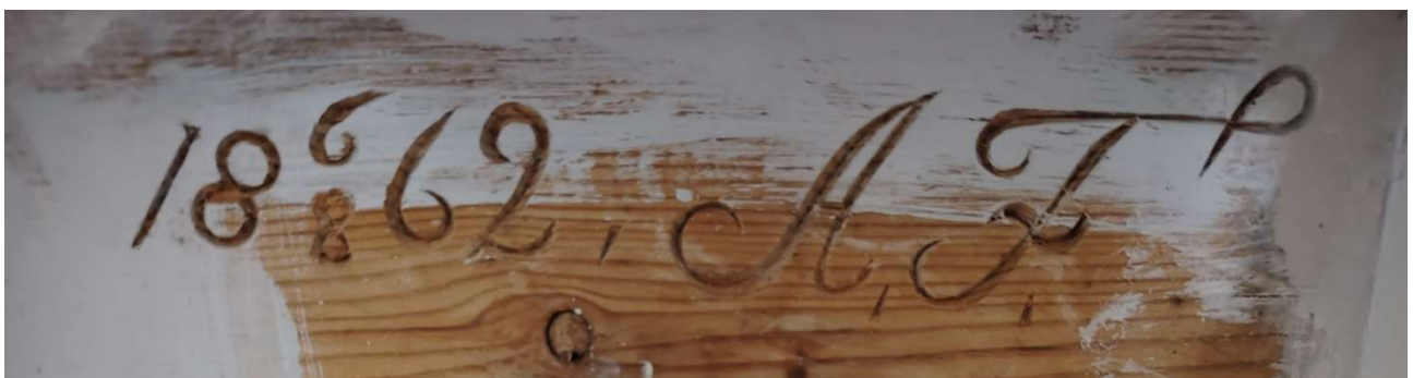
Jakkaran pohjassa oleva kaiverrus.